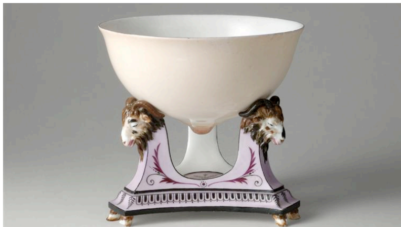
Bol sein, 1788, Sèvres, Musée national de la céramique

RDV à 9h15 devant les grilles du château, retrouvailles et embrassades