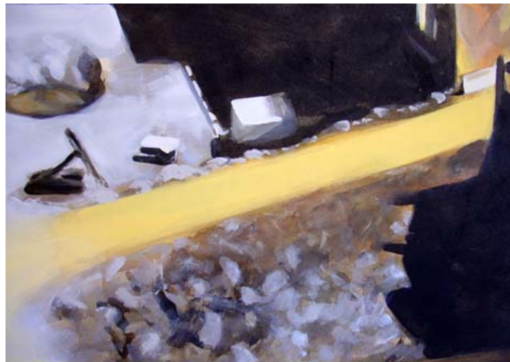
Isabelle Bonzom, Chantier dans la cité II , 1998. isabelle-bonzom.org