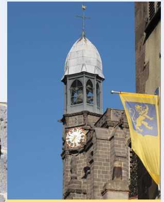
Montferrand-Renaissance, 1960-2010, un demi-siècle au service de la cité